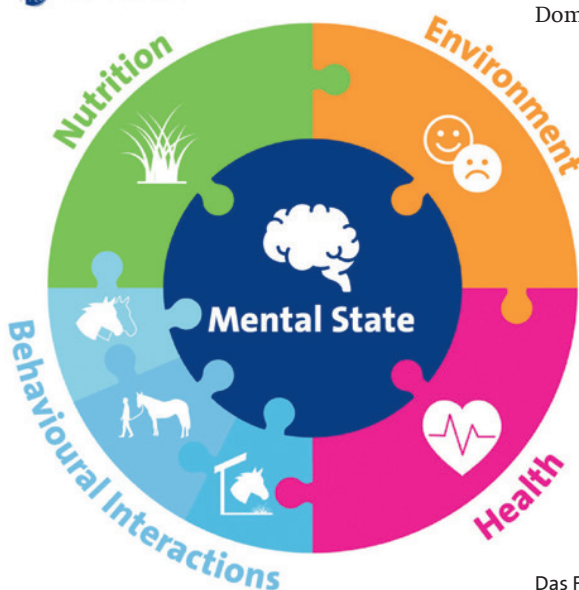
Das Five Domains Model.