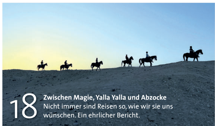
18 Zwischen Magie, Yalla Yalla und Abzocke Nicht immer sind Reisen so, wie wir sie uns wünschen. Ein ehrlicher Bericht.