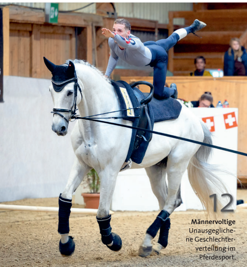
12 Männervoltige Unausgeglichene Geschlechter- verteilung im Pferdesport.