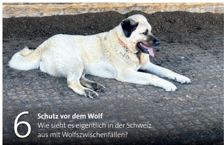
6 Schutz vor dem Wolf Wie sieht es eigentlich in der Schweiz aus mit Wolfswischenfällen?